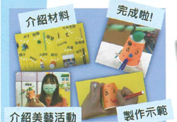
我們在家製作搖擺機械人。