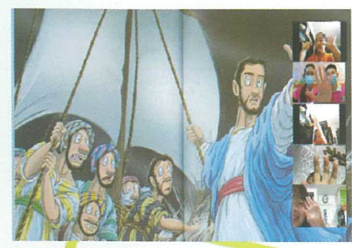
耶穌大哥哥，我相信你!