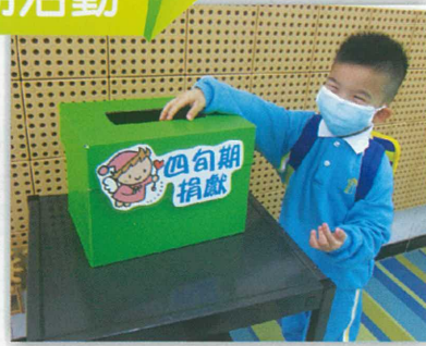
捐款幫助別人真開心呢！