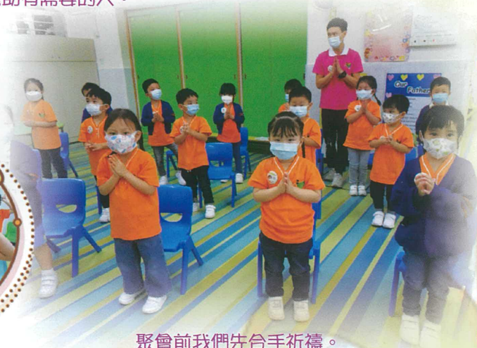
聚會前我們先合手祈禱。