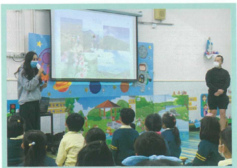
義工姐姐教導我們愛護大自然的方法。 THANK YOU哥哥、姐姐！