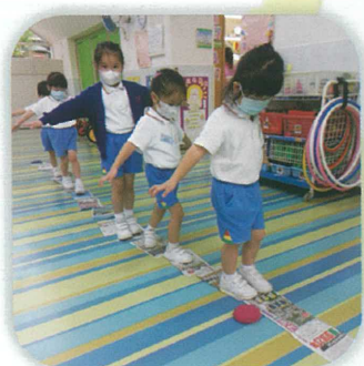
小心啊！沿著報紙向前走。