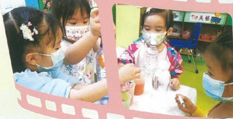
把水彩加進瓶子裡會有甚麼變化呢！