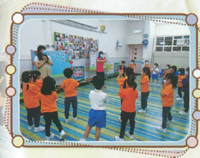
我們聆聽隊長指示。