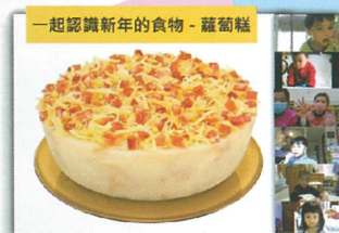
我們一起認識新年的食物