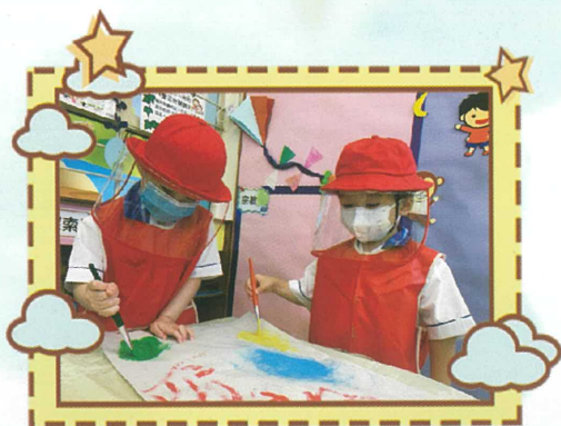
我們在自由畫大筆畫呢！