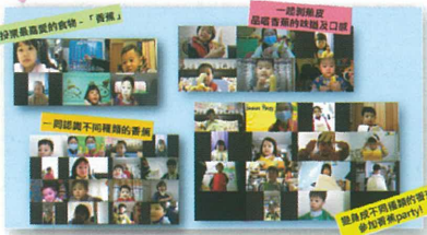
我們一起研究香蕉。