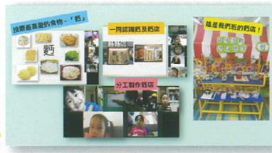
我們研究「麪」的主題呢!