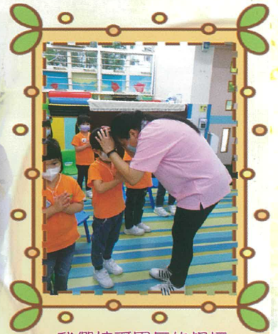
我們接受團長的祝福。