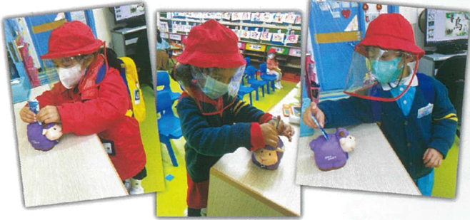
把捐款放進巴斯卦羊裡，幫助有需要的人。