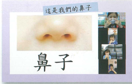
認識自己的身體部位。