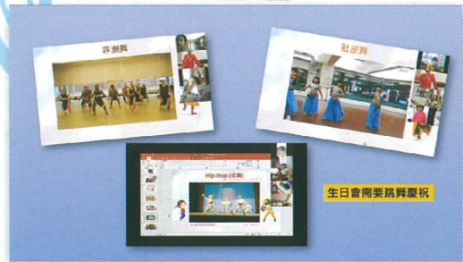
一起跳不同民族的舞蹈來慶祝生日吧!