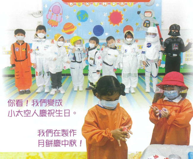
你看！我們變成小太空人慶祝生日。