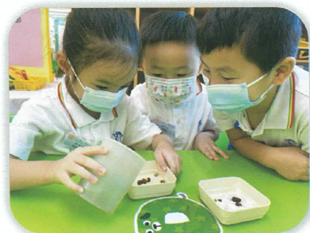
我們幫小種子澆水吧！