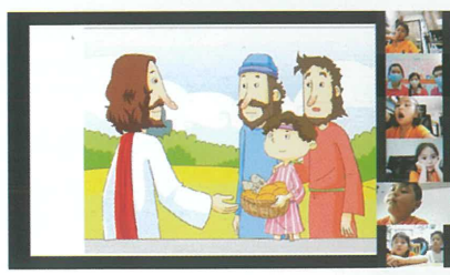
我們在聽《五餅二魚》故事。