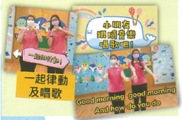
在家也可進行音樂遊戲。