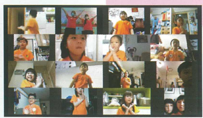
我們一起跳團歌吧!