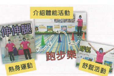
我們跟老師一起跑步!