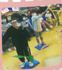
啦啦啦！我們在跳絲帶舞！