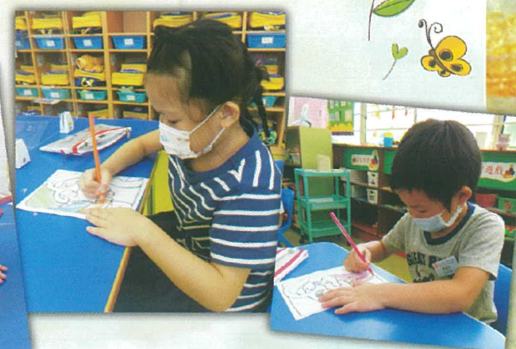
我們製作圖工獻給聖母媽媽。