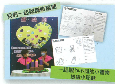
讓我們一起認識將臨期吧! 我們在家透過影片一起參加聖誕祈禱聚會!