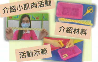
在家也可進行小肌肉活動。